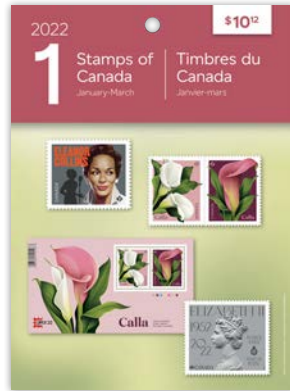
Janvier-mars 2022 402022101 10,12 $